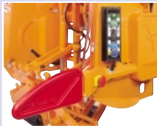
Overzichtelijk bedieningspaneel, noodstopvoorziening onder direct bereik van de bediener.