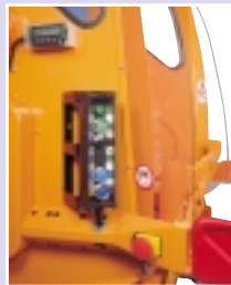
Bedieningspaneel aan de linkerzijde met daarboven de service display.