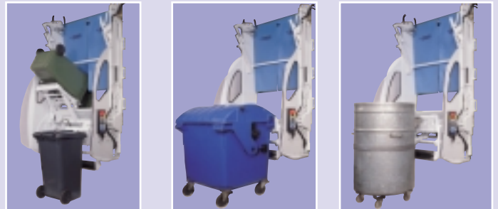
De zich onder de belading bevindende gemakkelijk bereikbare service box herbergt de hydraulische en elektrische componenten